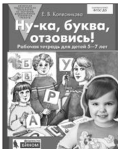
«Ну-ка, буква, отзовись!» Рабочая тетрадь для детей 5–7 лет