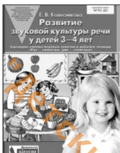
«Развитие звуковой культуры речи у детей 3–4 лет». Учебно-методическое пособие