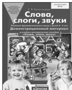
«Слова, слоги, звуки». Демонстрационный материал для занятий с детьми 4–5 лет