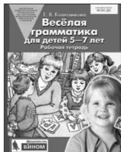
«Веселая грамматика для детей 5–7 лет». Рабочая тетрадь