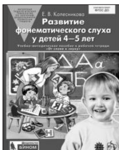
«Развитие фонематического слуха у детей 4–5 лет». Учебно-методическое пособие