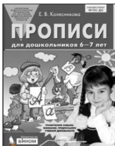
«Прописи для дошкольников 6–7 лет»