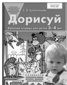
«Дорисуй». Рабочая тетрадь для детей 3–4 лет