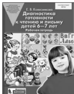
«Диагностика готовности к чтению и письму детей 6–7 лет». Рабочая тетрадь