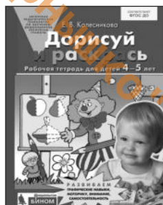
«Дорисуй и раскрась». Рабочая тетрадь для детей 4–5 лет