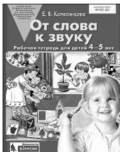
«От слова к звуку». Рабочая тетрадь для детей 4–5 лет