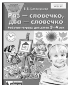
«Раз — словечко, два — словечко». Рабочая тетрадь для детей 3–4 лет