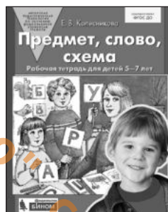
«Предмет, слово, схема». Рабочая тетрадь для детей 5–7 лет